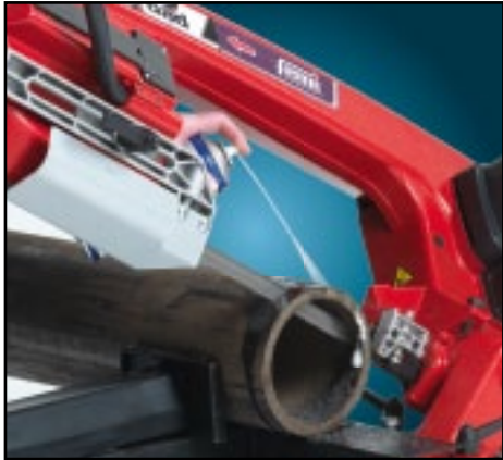
Possibility to make cuts with lubrication. Posibilidad de hacer cortes con la lubricación.