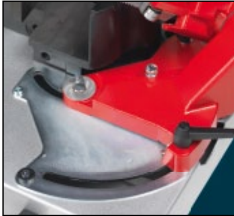
Exclusive "roto-translating" arm system (patent pending). Sistema exclusivo del brazo "roto-traslación" (patente pendiente).