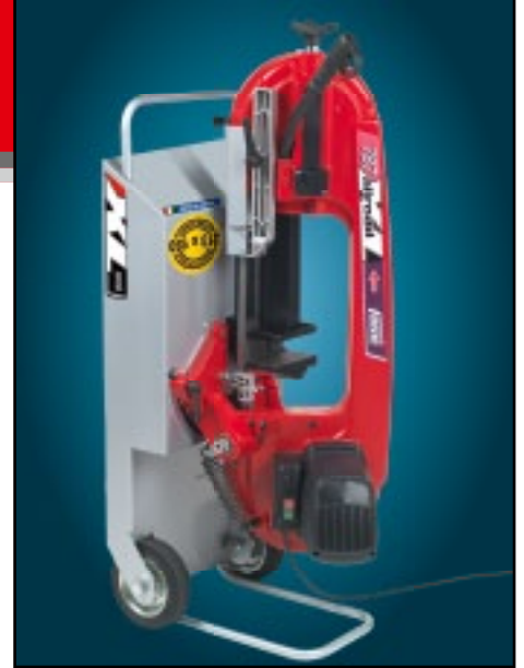
Compact, stable and easy to carry. Compacta, estable y transportable.