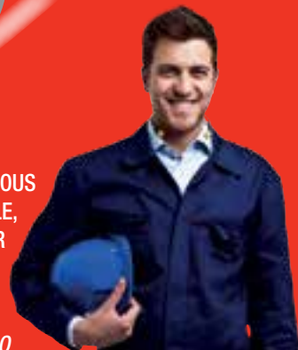
CICLO DE CORTE COMPLETAMENTE AUTÓNOMO, SIN PRESENCIA DEL OPERARIO