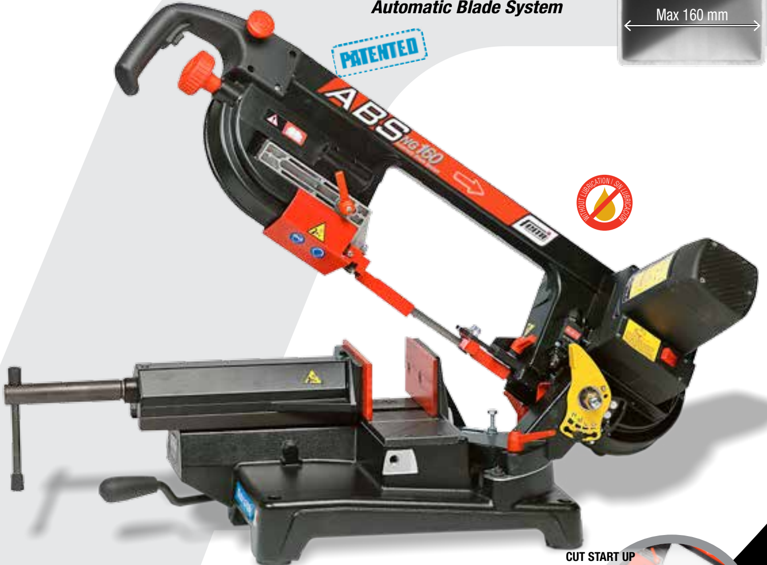
CUT START UP PUESTA EN MARCHA DEL CORTE