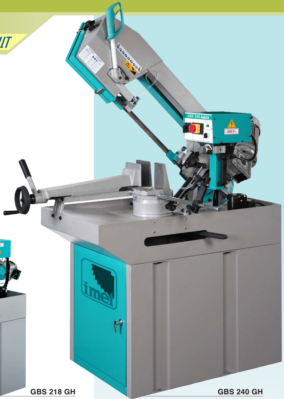
GBS 240 GH

IT - La segatrice manuale, o con discesa a gravità, ideale per la manutenzione e le piccole produzioni di profilati, tubi e solidi fino a 60° sinistra.