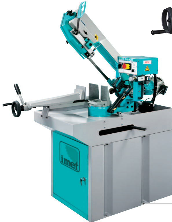
GBS 218 GH